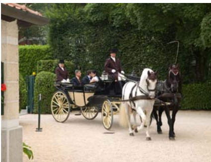
Giri in carrozza nel parco della "La Lodovica"

Mercoledì 11 giugno il Catalogo day ha avuto luogo presso "La Lodovica", antica tenuta di campagna ad Oreno di Vimercate (Mi), mentre giovedì 19 giugno il Catalogo day si è svolto presso "Villa Borromeo" a Sarmeola di Rubano (Pd).