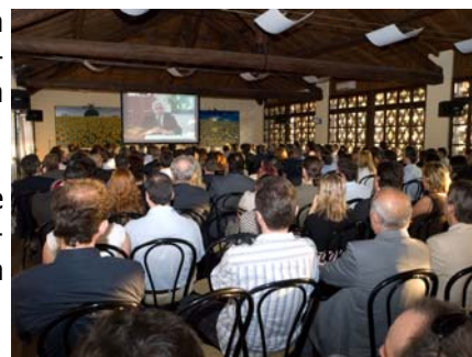
Gli ospiti nel corso della proiezione del filmato

"dettagliate ricerche per analizzare le richieste provenienti dal mercato, instaurando un rapporto di massima fiducia e trasparenza con tutti i nostri clienti. La lealtà e la piena chiarezza verso i nostri partner, fornitori e clienti, è stata la nostra politica vincente, perché riteniamo che alla base di tutto deve sempre esserci un rapporto di reciproca fiducia; che si è trasformata negli anni in solide e concrete partnership che ci stanno portando risultati eccellenti".