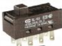
SL - 101