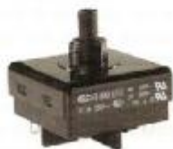
ST - 800