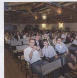
Un momento della presentazione del Catalogo Quinto di Comestero Sistemi

risposte dettagliate e precise ai quesiti tecnici e alle esigenze di produzione e di conformità nei confronti delle normative vigenti nel mondo. Il nuovo catalogo, il quinto realizzato negli anni da Comestero Sistemi, offre al cliente la possibilità di conoscere la società a 360°, riportando i dettagli storici